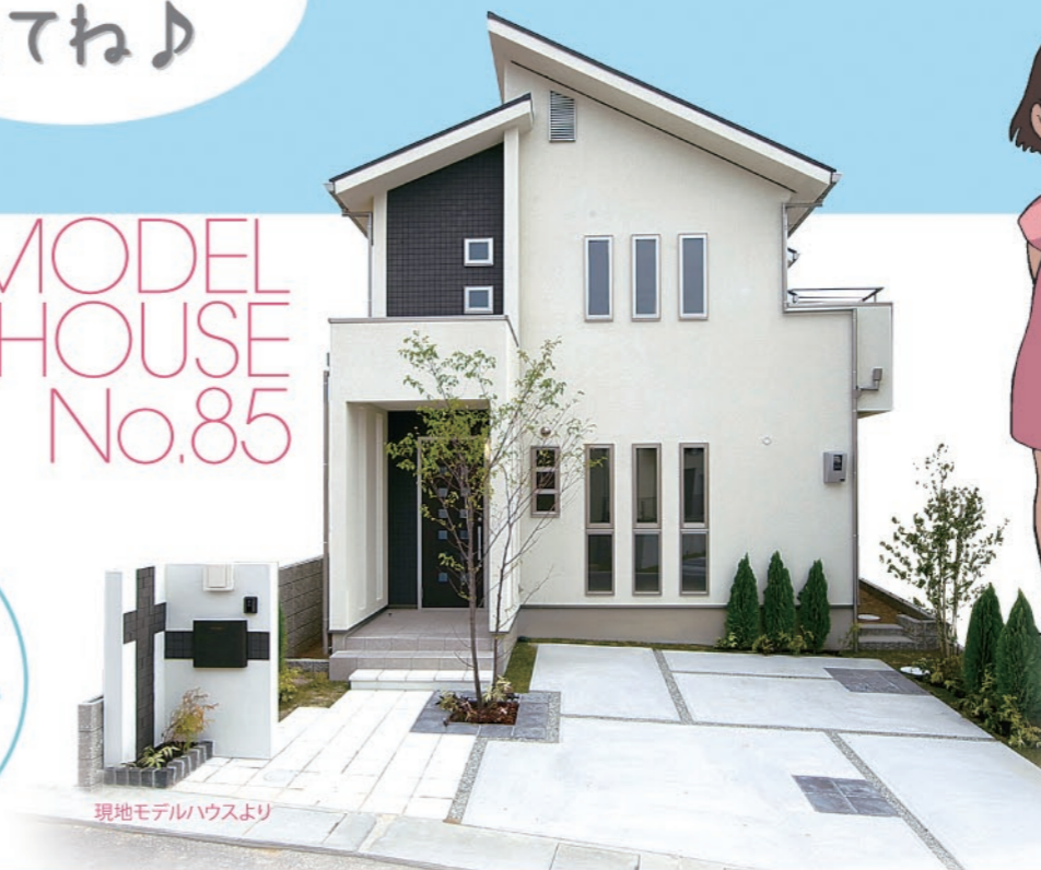
現地モデルハウスより